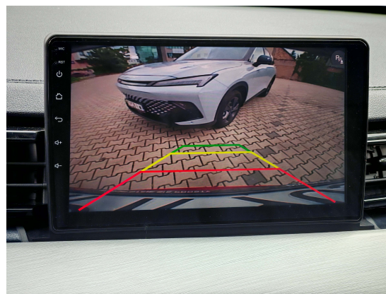
Kamera cofania z dynamicznymi liniami pomocniczymi