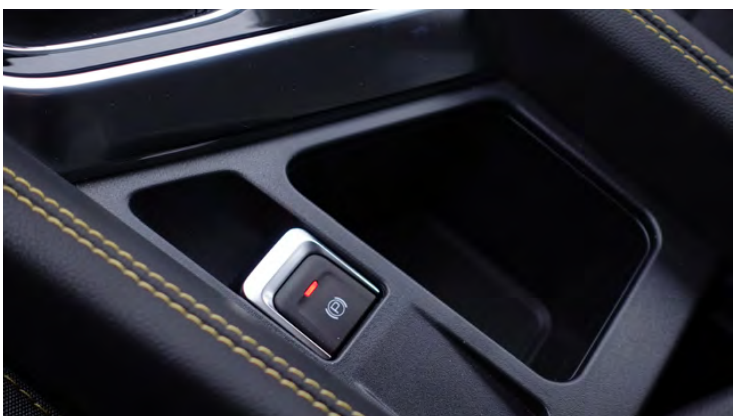
Elektryczny hamulec postojowy