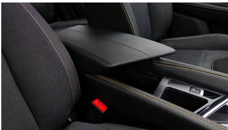
Elegancki i praktyczny podłokietnik ze schowkiem