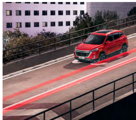
System wspomagania nagłego hamowania EBA