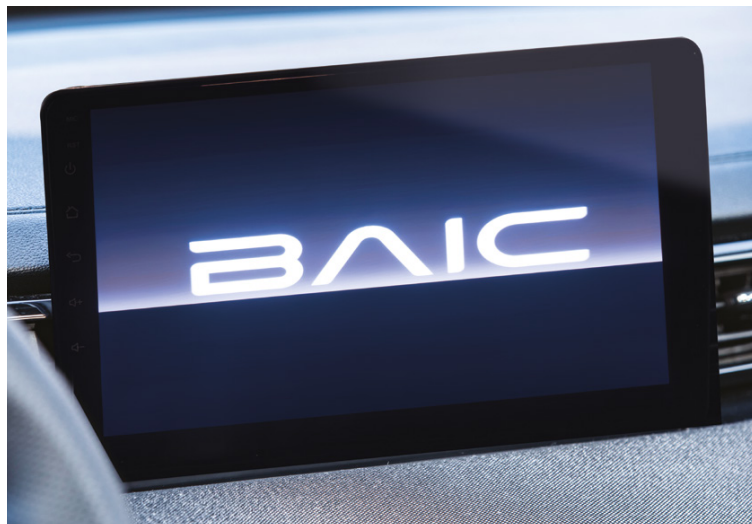
10-calowy multimedialny ekran dotykowy z systemem Android / menu wyświetlacza w języku polskim / obsługa bezprzewodowa Android Auto™ oraz Apple CarPlay™ *

*Dotyczy samochodów od produkcji czerwiec 2025