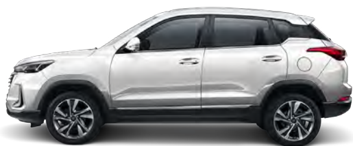
Biały perłowy CAQ