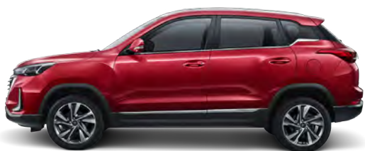
Czerwony metalizowany BAQ