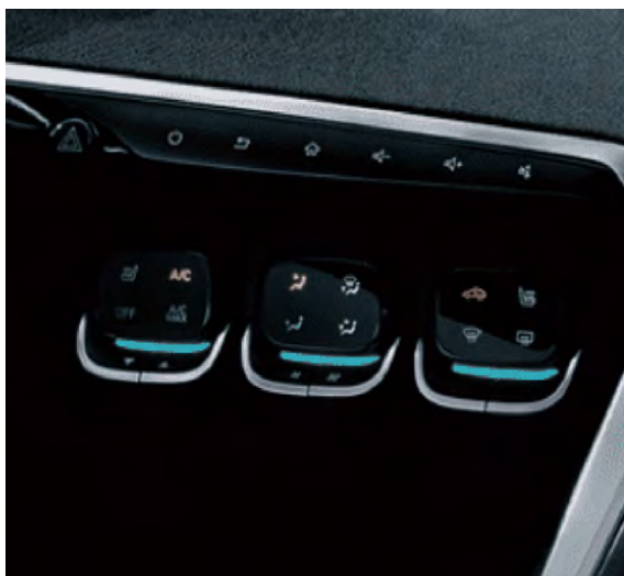
Elegancki panel sterowania systemem klimatyzacji