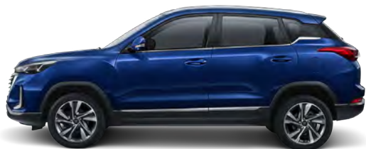
Niebieski metalizowany EAT